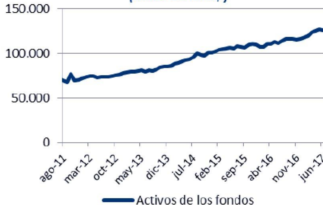
Evolución Valor de los Fondos (miles de MM$)