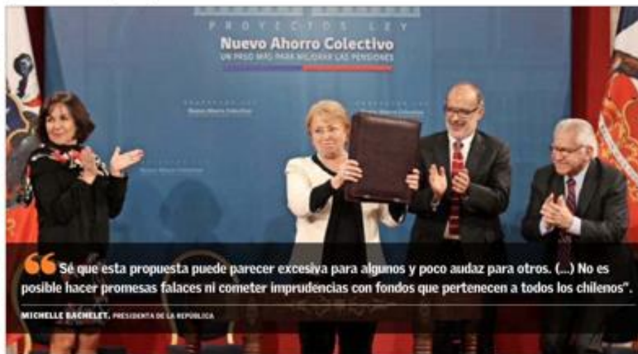
CEREMONIA.— La Presidenta Bachelet firmó los proyectos de pensiones en La Moneda, acompañada de los ministros de Trabajo, Alejandra Krausz; de Hacienda, Rodrigo Valdés, e Interior, Mario Fernández.

Del 5% de cotización adicional que administrará la nueva entidad estatal, 3 puntos irán a una cuenta personal de los trabajadores y 2 puntos a un fondo común que se distribuirá beneficiando mayormente a las pensiones más bajas. “Tenemos que como entidad estatal, a los