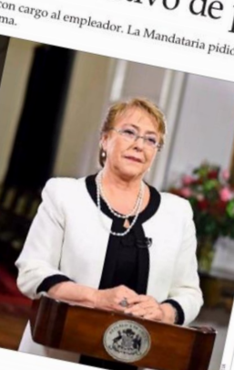
MICHELLE BACHELET, PRESIDENTA DE LA REPÚBLICA

"Me pareció una posición seria se nota que esto se venía estudiando y da una salida esperanzadora".